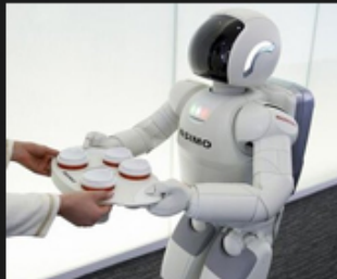
06 Smart device