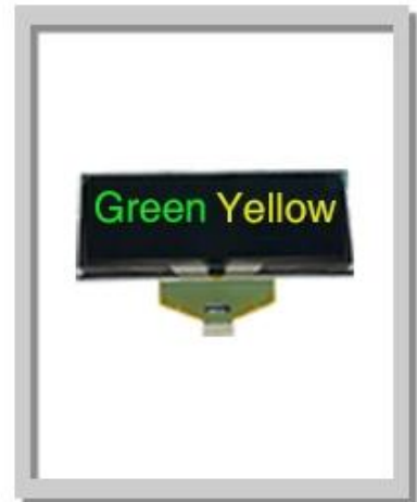
5.50 Inch 256x64