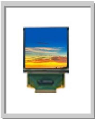
1.50 Inch 128x128