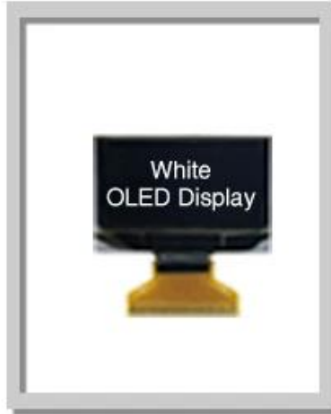
1.30 Inch 128x64