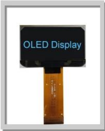
1.54 Inch 128x64