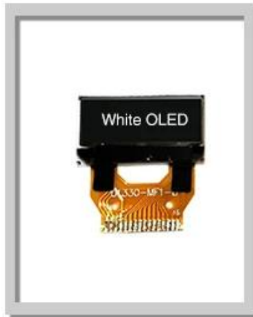
0.68 Inch 96x32