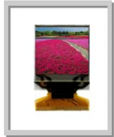
1.10 Inch 96x96