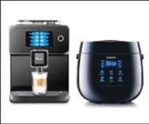
01 Civilian equipment