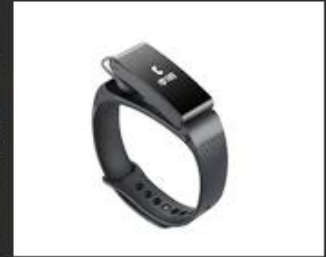
04 Mini screen