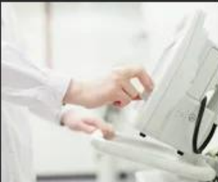
05 Medical and beauty equipment