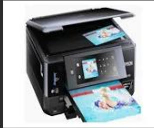
02 Office tools