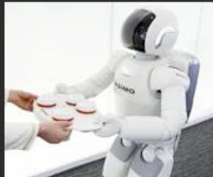
06 Smart device