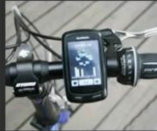
03 Traffic instrument