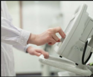
05 Medical and beauty equipment