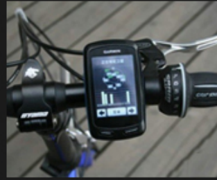
03 Traffic instrument