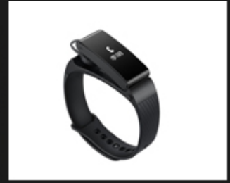
04 Mini screen