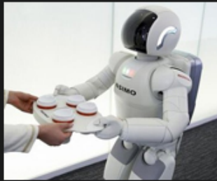
06 Smart device