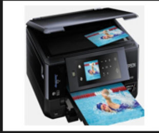
02 Office tools