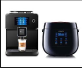
01 Civilian equipment