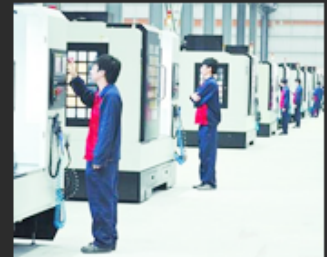
08 Control system