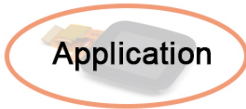
Other Electronics Products