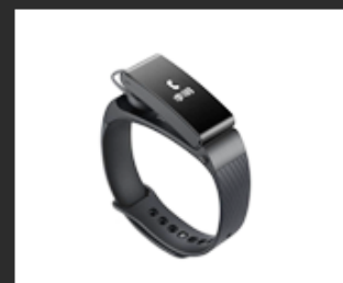
04 Mini screen