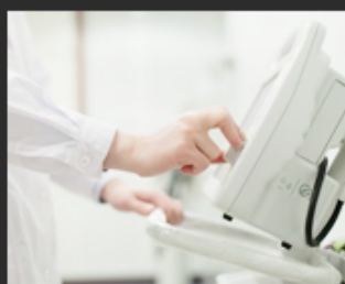
05 Medical and beauty equipment