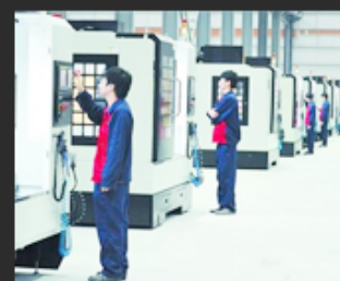
08 Control system