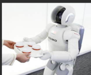
06 Smart device