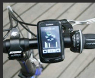
03 Traffic instrument