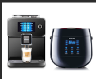
01 Civilian equipment