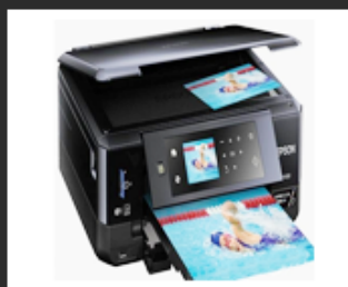
02 Office tools