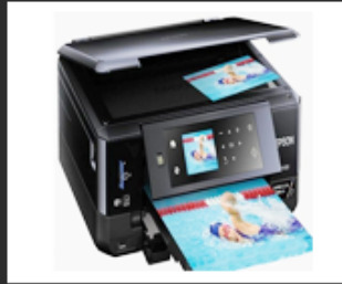
02 Office tools