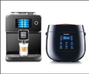
01 Civilian equipment