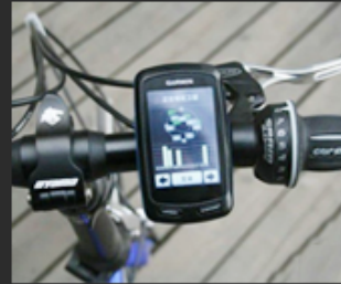
03 Traffic instrument