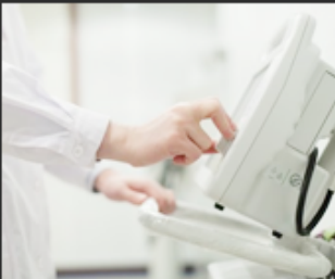
05 Medical and beauty equipment