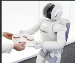
06 Smart device