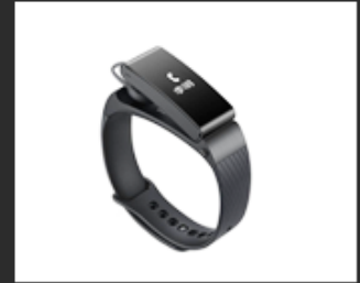
04 Mini screen